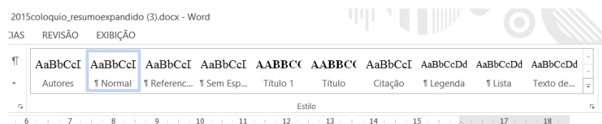
Figura 1 – Estilos do Word

O texto deverá ser produzido em programa Word, formatado para o tamanho de página A-4, com margens superior, inferior, esquerda e direita de 2,5cm. O texto deverá ser confeccionado em modo justificado, espaçamento entre linhas simples e empregada fonte Time New Roman, corpo 12. Procure utilizar os Estilos do Word conforme Figura 1.