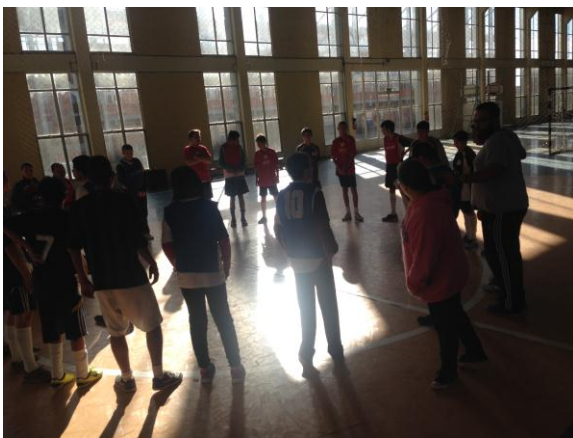
Bate papo inicial do AMISTOSO FUTSAL – III Semana da Acessibilidade ULBRA