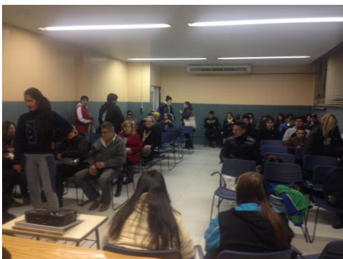
Chegada para a palestra – III Semana da Acessibilidade ULBRA