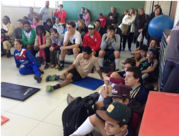
Ensaio aberto Expressão Down Up – III Semana d Acessibilidade ULBRA