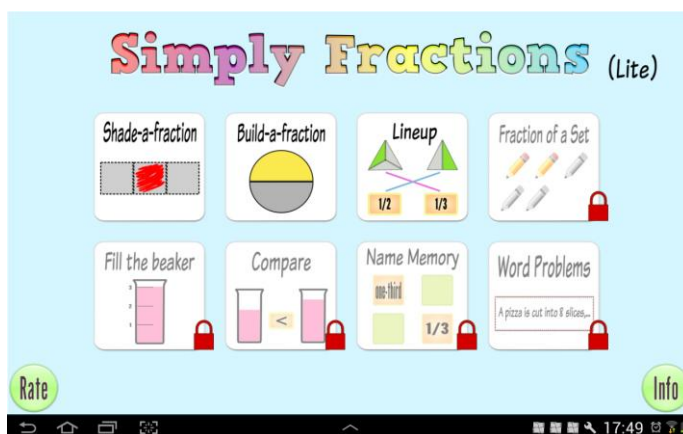
Figura 2 – Conteúdos abordados no Aplicativo 1

“Simply Fractions” é uma série de 3 aplicativos que desenvolvem o estudo de frações. No primeiro aplicativo da série, é ensinado o conceito de frações de maneira ilustrada, trabalhando, principalmente, exercícios de pintar a fração correta e comparação de frações.