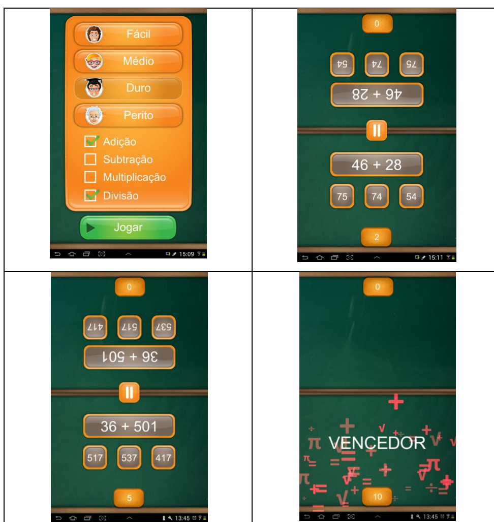
Figura 1 - Interface do aplicativo Math Duel

Este aplicativo deve ser jogado por dois alunos, com a tela dividida em duas partes iguais, onde ganha quem marcar, primeiro, 10 pontos. A figura 1 apresenta o referido aplicativo.