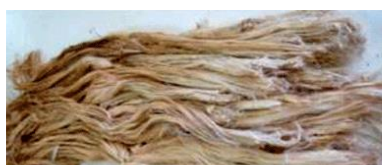
Fibra de curauá como recebida

Agente reforçante → 5 e 10% em massa fibra vegetal de curauá (FC) (Ituá Agroindustrial, quando requerida).