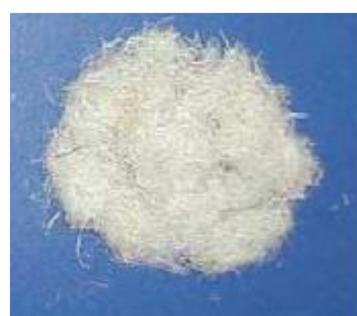
Fibra tratada vpm NaOH e moída

Agente de acoplamento → 3% em massa de PP com anidrido maleico (Polybond).