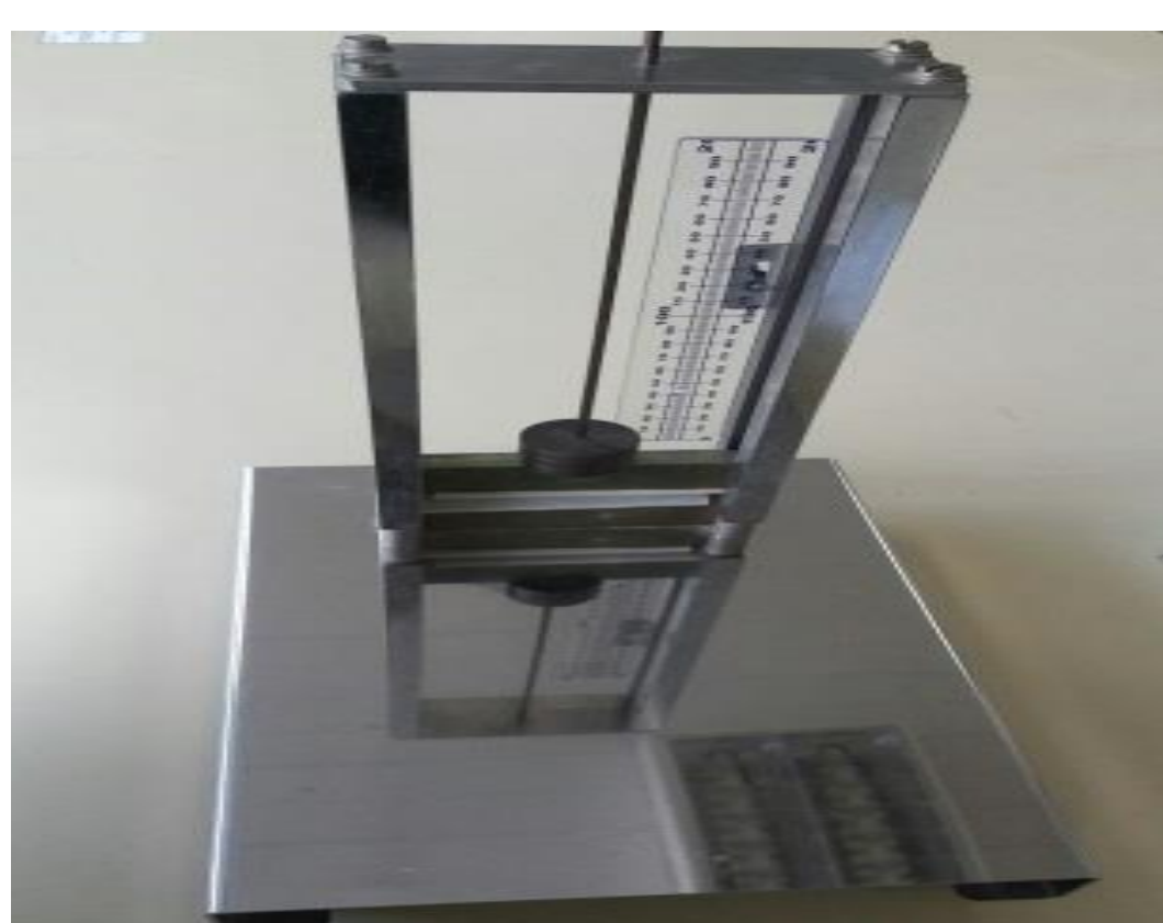
Figura 1: Prensa desenvolvida para indução de trauma muscular em ratos, com impacto de 0,811J.

Durante o experimento, os animais foram mantidos em caixas medindo 47cm x 34cm x 18cm, forradas com maravalha, em ciclo de 12 horas claro/escuro e temperatura entre 18 e 22°C. A água e a ração foram distribuídas ad libitum . O modelo experimental foi induzido por impacto simples de contusão por meio de uma prensa.