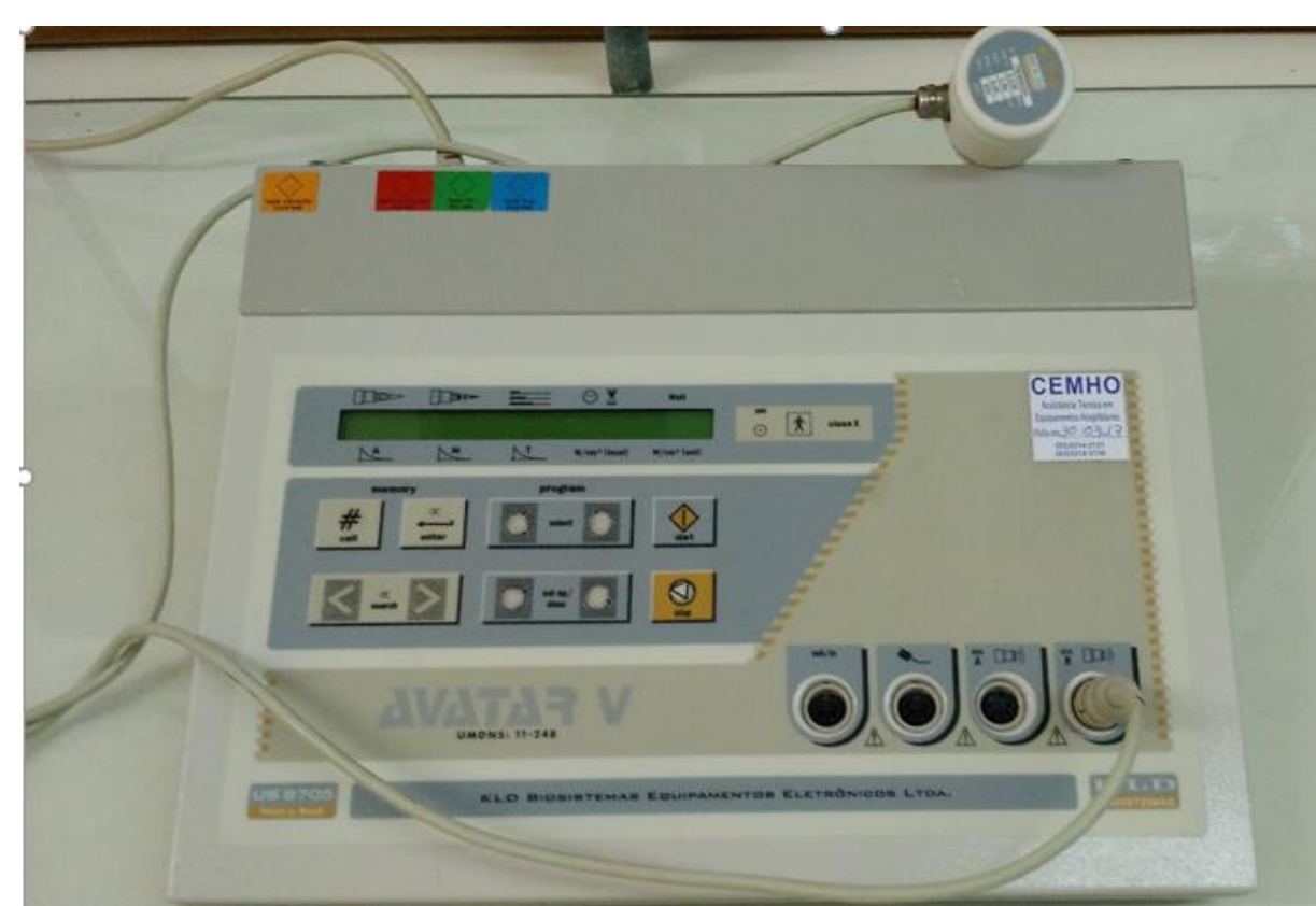
Figura 2: Aparelho de Ultrassom terapêutico da marca KLD, modelo AVATAR V.

O tratamento foi realizado no mesmo período do dia durante 3 minutos e iniciou-se 24 horas após a indução do trauma, utilizando como meio de contato um gel hidrossolúvel e realizando movimentos circulares sobre o local da lesão. No nono dia, os animais foram submetidos à eutanásia por overdose anestésica e foi coletado o músculo quadríceps direito para análises bioquímicas e avaliações histológicas. Projeto aprovado sob o nº 2016-159P.