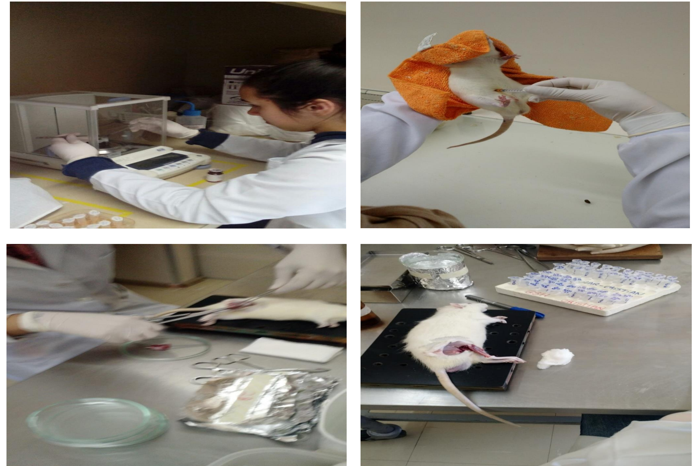
Figura 3: Registro fotográfico do desenvolvimento do modelo experimental. Pesagem dos reagentes utilizados no experimento (A), procedimento de overdose anestésica (B), e retirada do músculo gastrocnêmio para as análises bioquímicas e histológicas (C e D).