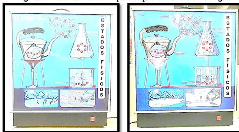
Figura 1: Material eletrônico para esquematizar o ciclo da água

Depois da explicação sobre a molécula da água e do ciclo desta por meio do suporte eletrônico, o qual apresenta um panorama de luzes e movimento de gases, os estudantes foram convidados a assistirem um vídeo sobre a importância da água e realizar uma história em quadrinhos de três tiras sobre o vídeo apresentado, o qual encontra-se disponível no link: