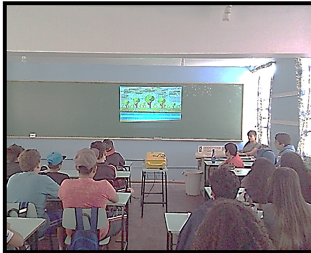
Figura 2: Vídeo sobre a Importância da Água trabalhado com os alunos do 8º ano.

O vídeo foi importante porque em forma de animação ele retrata a dura realidade brasileira em relação a falta de água e, em especial, sobre as ações humanas sobre este fato, ou seja, o quanto o ser humano está interferindo no ciclo da água através do desmatamento. Este vídeo instigou o aluno a pensar sobre e, por meio de questionamentos, refletirem o que cada um de nós fará a respeito da crise hídrica no Brasil, não colocando a responsabilidade no poder público, mas como um contínuo de todos.