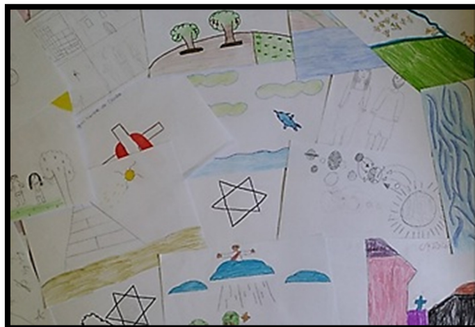
Figura 2 - Representações da “Origem da Vida” pelos alunos.

Pode-se notar uma variedade de interpretações sobre o contexto, tendo-se a religião e a ciência os embasamentos mais utilizados. A discussão sobre a atividade ocorreu através de uma dinâmica, onde os desenhos eram mostrados um a um (figuras 3) e os alunos eram escolhidos aleatoriamente para descrever o desenho apresentado. Esta ação se configura na maximização de concepções dos alunos por meio da troca de saberes entre eles, pois aquele que desenhou não teve a interpretação no ato de desenhar igual aquele que, randomicamente, foi selecionado para falar sobre o desenho; logo, novas ideias surgiram e a aprendizagem de forma cooperativa e colaborativa se estendeu no decorrer do trabalho.