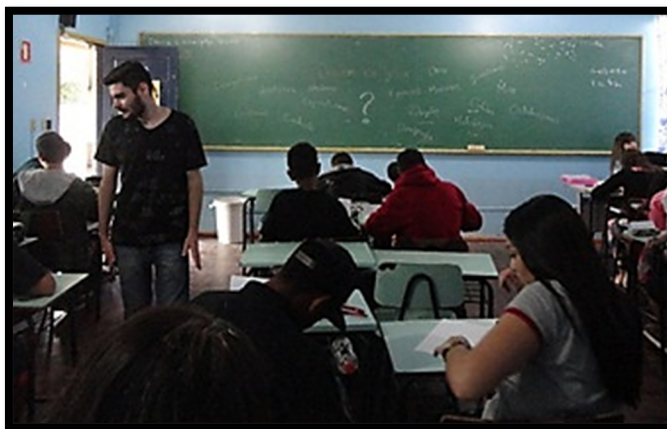
Figura 4 - Orientações sobre os textos da “Origem da Vida”.

Após lerem e discutirem o texto recebido no próprio grupo, abriu-se uma discussão em grande grupo para que todos pudessem compreender a diversidade das abordagens. Foi ressaltado a importância de conhecer mais sobre a cultura dos povos indígenas, bem como a relevância de discutir explicações religiosas e científicas, a fim de que eles comparassem diferentes pontos de vista presentes na sociedade. Desta forma, obteve-se um momento significativo de aprendizagem, oferecendo aos alunos uma participação efetiva. Segundo Delizoicov e Angotti (1994, p. 22) “as experimentações quando planejadas, [...]constituem momentos particularmente ricos no processo de ensino-aprendizagem”.