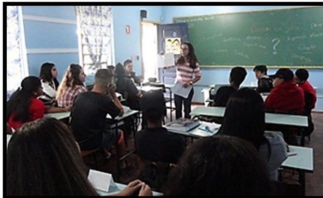
Figura 3 - Dinâmica envolvendo os desenhos sobre a “Origem da Vida”.

Após o aluno escolhido aleatoriamente comentar o desenho mostrado, foi solicitado que o autor do desenho de manifestasse e também comentasse a respeito do seu trabalho. Assim, foi possível averiguar que um mesmo desenho gerava diferentes explicações, proporcionando aos alunos uma experiência de troca de opiniões, ideias e respeito mútuo.