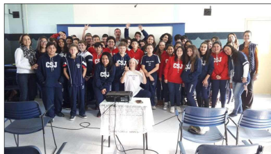
Palestra no Colégio São João - Canoas