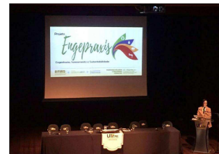
Apresentação no 8º Fórum de Resíduos Sólidos - Curitiba

REFERÊNCIAS: MOISÉS, Márcia et al. A política federal de saneamento básico e as iniciativas de participação, mobilização, controle social, educação em saúde e ambiental nos programas governamentais de saneamento. Ciência & Saúde Coletiva , v. 15, n. 5, 2010.