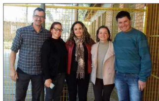
Palestra no Colégio Homero Fraga - Nova Santa Rita