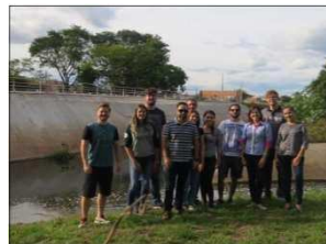
Visita campo para diagnóstico do Arroio Guajuviras - Canoas