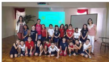
Palestra no Colégio Cristo Redentor - Canoas