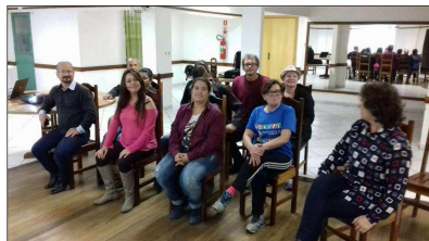
Associação dos Moradores Vila Hércules - Canoas