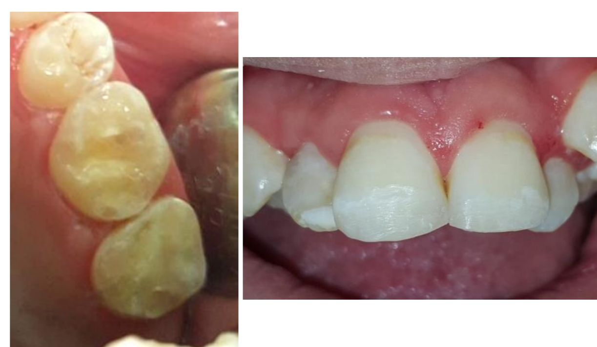
Fig. 9 e 10 - Detalhe CIV 26 e 27. 11 e 21 Restaurados