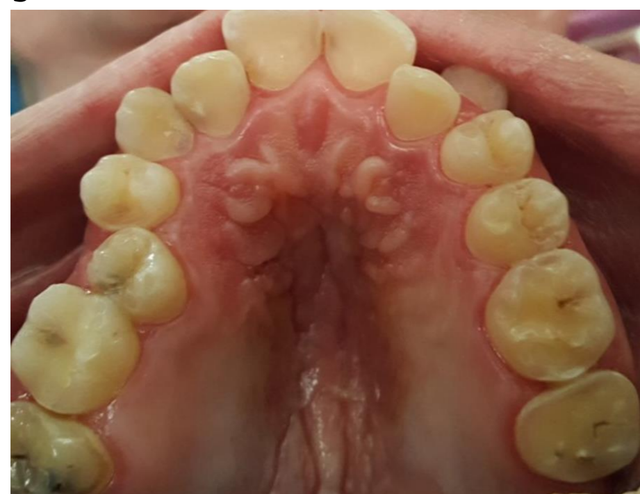
Fig. 8 - 14, 16, 17, 26 e 27 - CIV

Neste caso clínico o paciente faz uso frequente e constante de suco e refrigerante desde muito tenra idade. O plano de tratamento incluiu mudanças dietéticas, orientação de HB com dentifrício fluoretado, raspagens supragengivais, ATF e tratamento restaurador no dente 12, que apresentava cavidade de cárie interproximal. Nos dentes posteriores que apresentavam desgastes por erosão (14, 16, 17, 26, 27, 37 e 47) optou-se pelo recobrimento com Cimento de Ionômero de Vidro. Nos dentes 11 e 21 foram realizadas restaurações estéticas com resina composta.