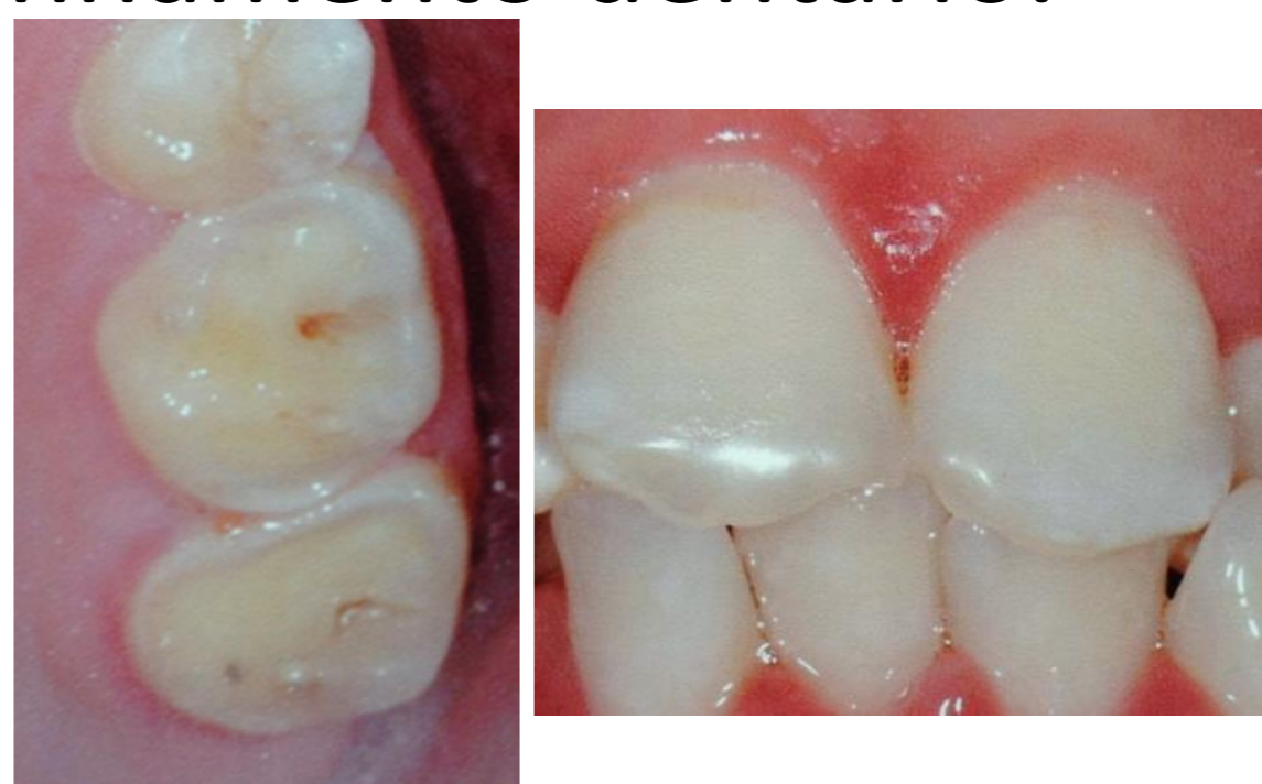
Fig. 4 e 5 - Detalhe da erosão no 26 e 27 e nos dentes 11 e 21