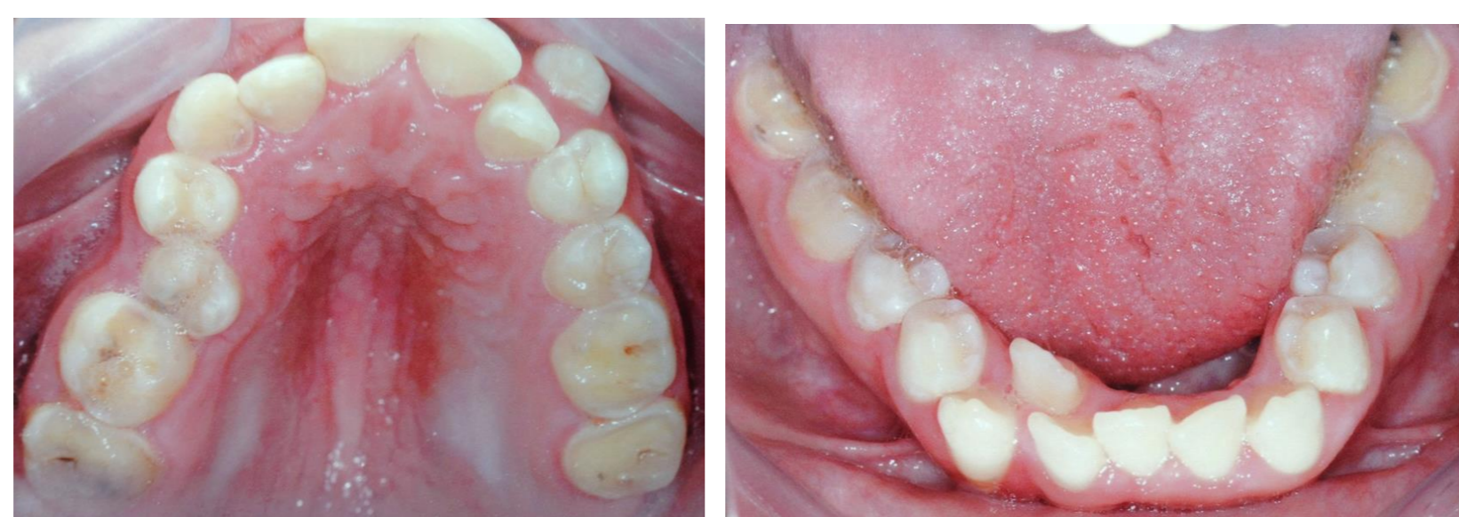
Fig. 2 e 3 - Arcadas superior e inferior