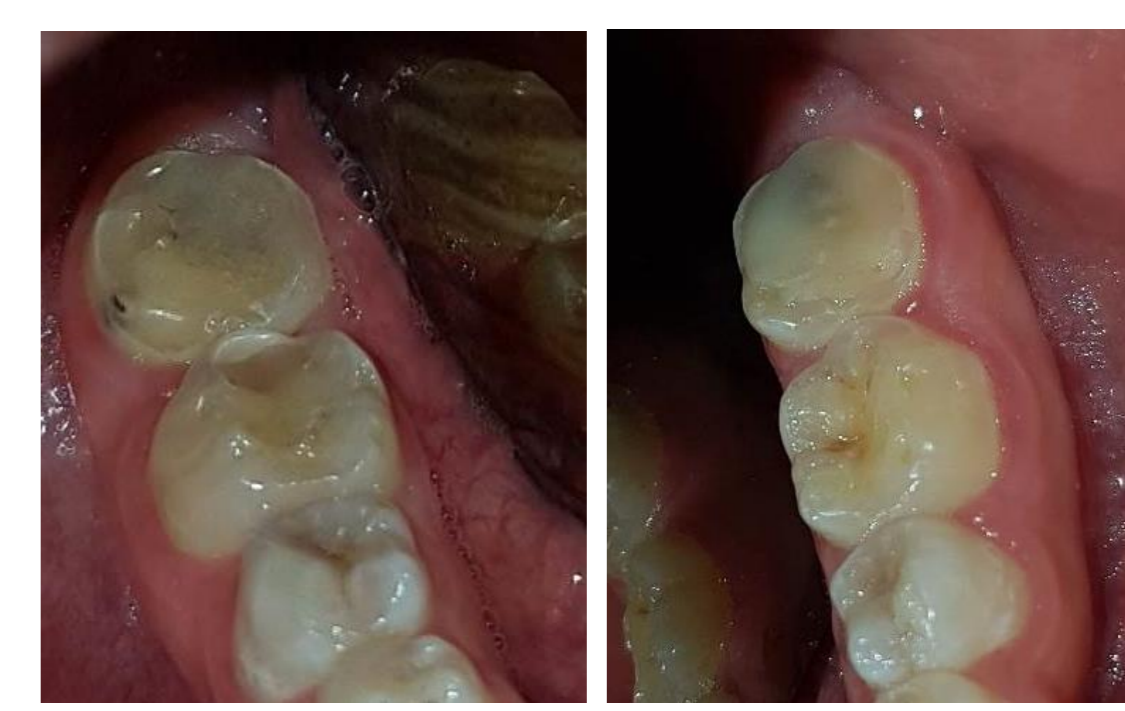
Fig. 11 e 12 - Dentes 37 e 47 com CIV