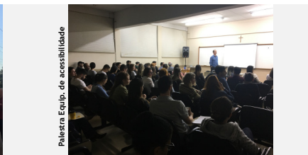
Palestra Equip. de acessibilidade