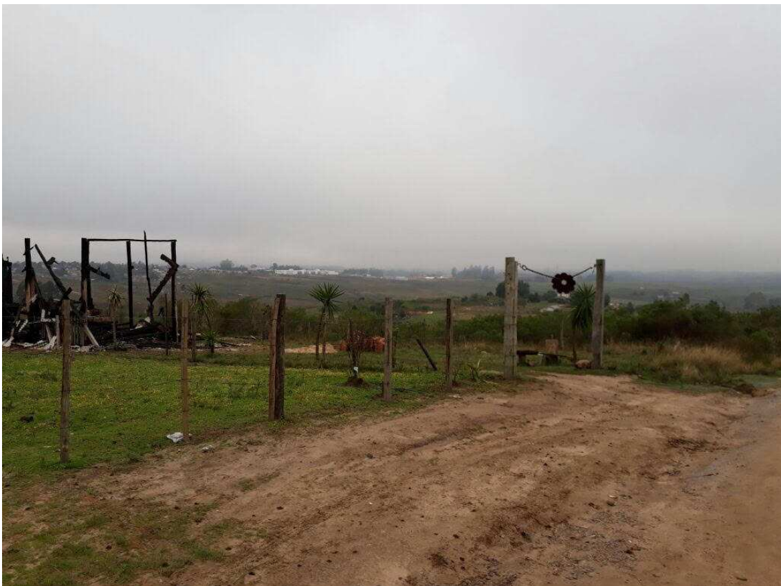
Fotografia 03. Vista da invasão do bairro Nova Santa Marta.