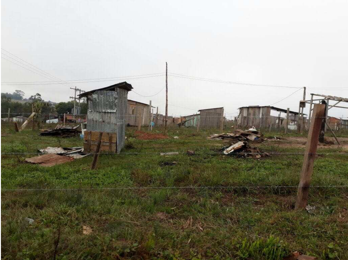
Fotografia 02. Vista da invasão do bairro Nova Santa Marta.