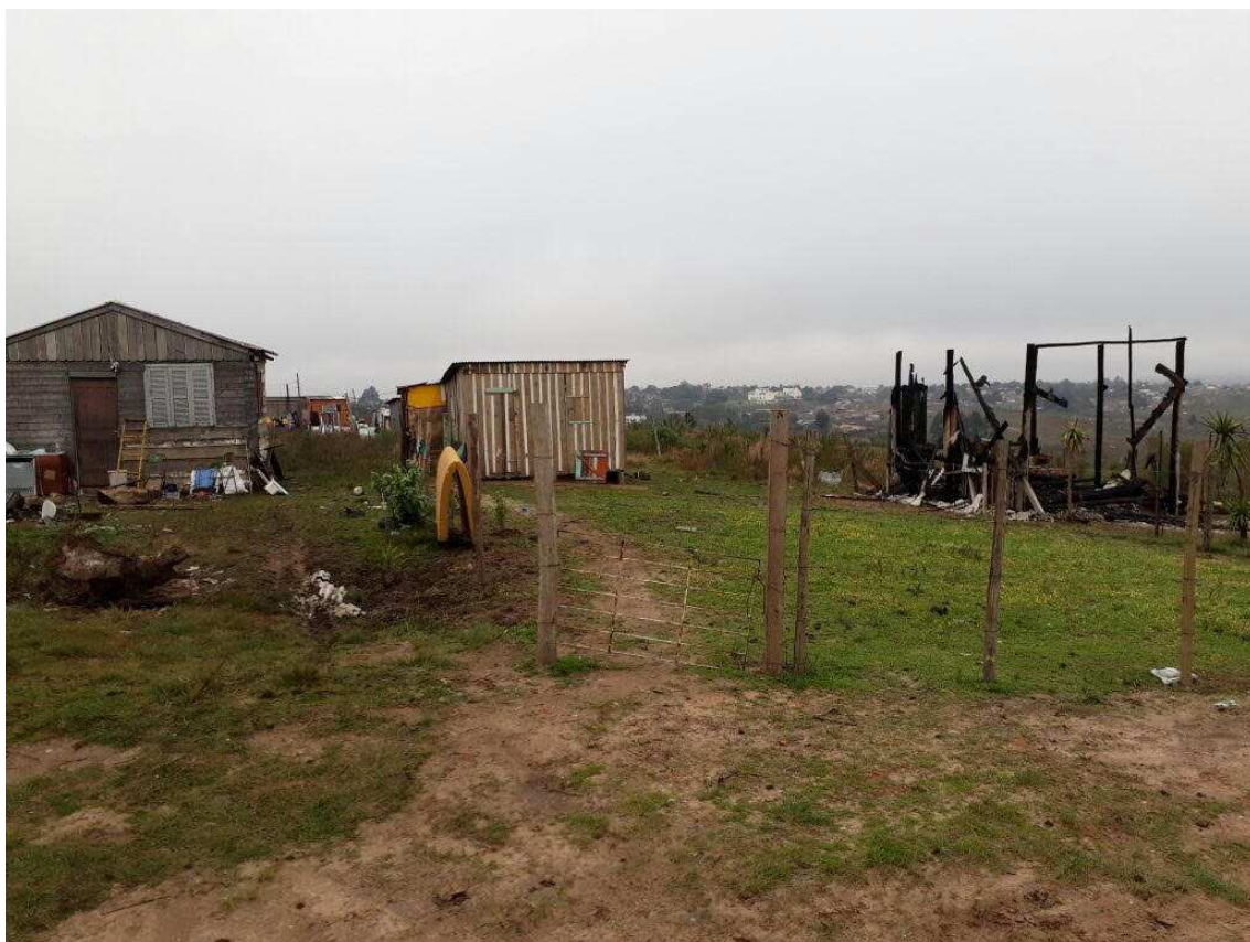
Fotografia 01. Vista da invasão do bairro Nova Santa Marta.