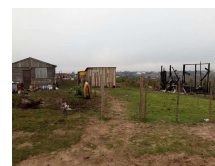
Fotografia 01. Vista da invasão do bairro Nova Santa Marta.