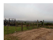
Fotografia 03. Vista da invasão do bairro Nova Santa Marta.

DESCRITORES: Direitos Humanos; Observatório; Santa Maria; Violência.