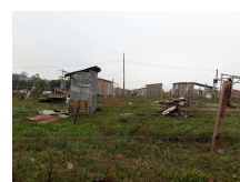
Fotografia 02. Vista da invasão do bairro Nova Santa Marta.