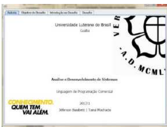
Figura 2 – Aba Autoria do Objeto de Aprendizagem