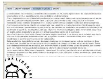
Figura 4 - Aba Introdução ao Desafio do Objeto de Aprendizagem