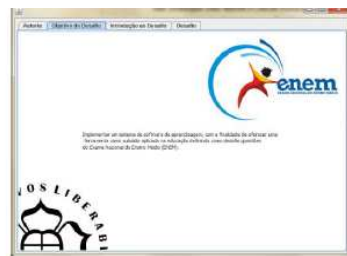
Figura 3 - Aba Objetivo do Desafio do Objeto de Aprendizagem