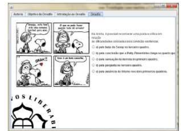
Figura 5 - Aba Desafio do Objeto de Aprendizagem