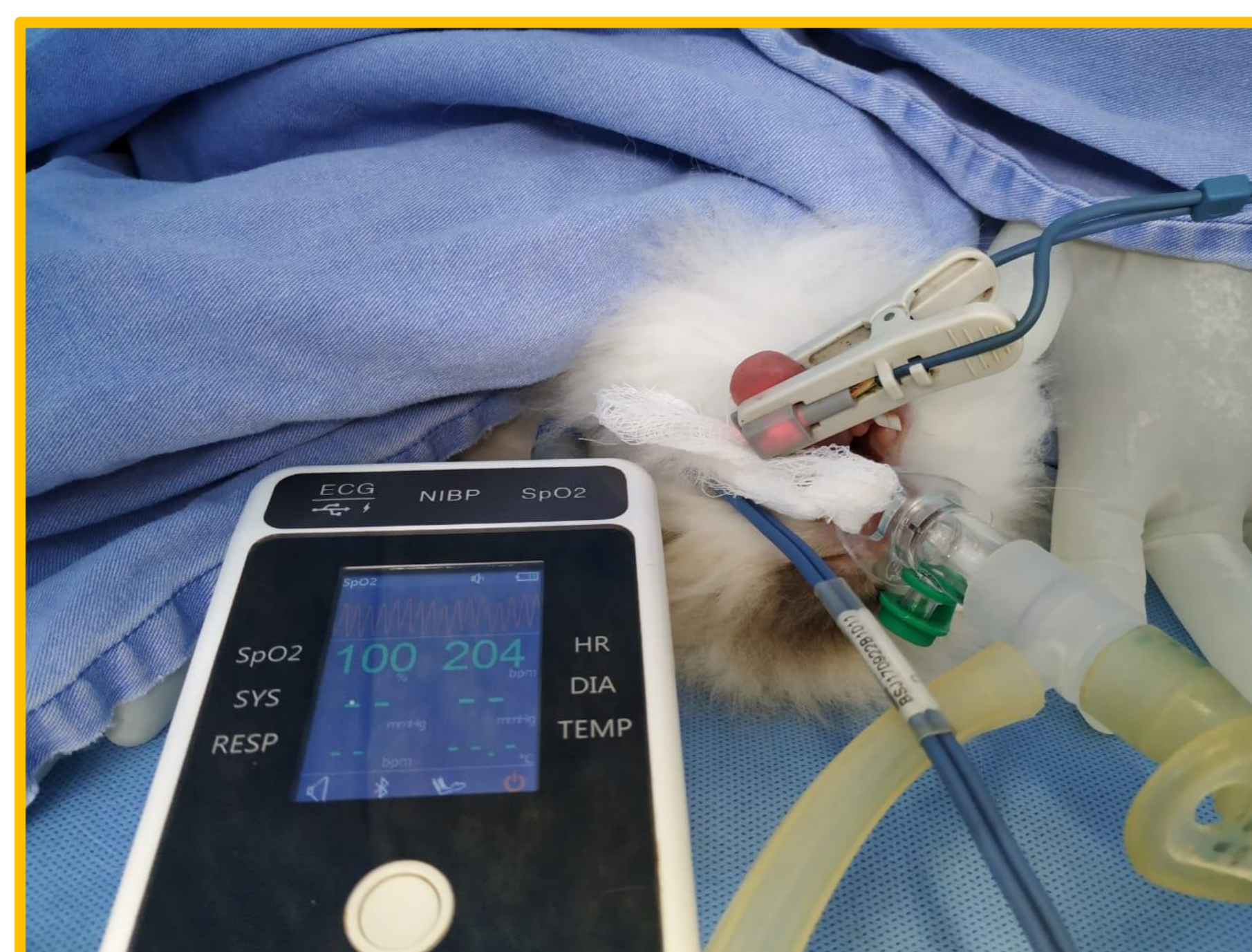
Figura 2: Coelho anestesiado com isoflurano, recebendo o anestésico volátil através do uso de máscara laríngea