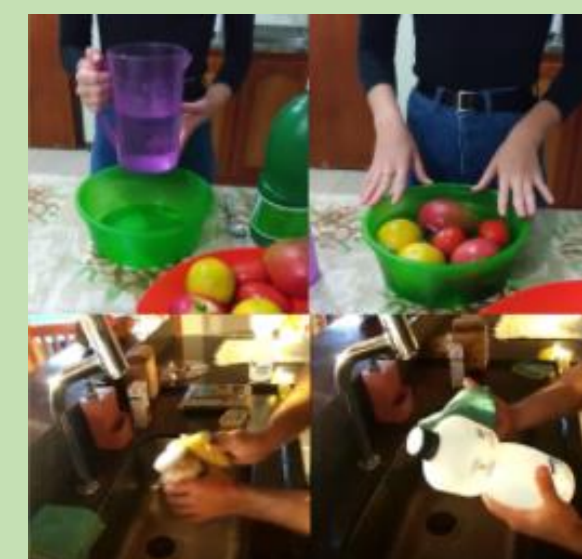
Fotos retiradas do vídeo realizado sobre Higienização de Frutas e Verduras.