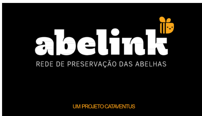
Figura 1. Imagem representativa da Rede de Preservação das Abelhas, Abelink

identidade mais ampla, organizando workshops participando da Virada Sustentável em Porto Alegre, eventos em datas importantes como o Dia do Meio Ambiente, além disso, em parceria com uma agência de marketing, o Abelink tomou uma roupagem própria criando uma marca identitária para melhor divulgação da proposta (Figura 1), além da divulgação científica nas redes sociais Facebook e Instagram.