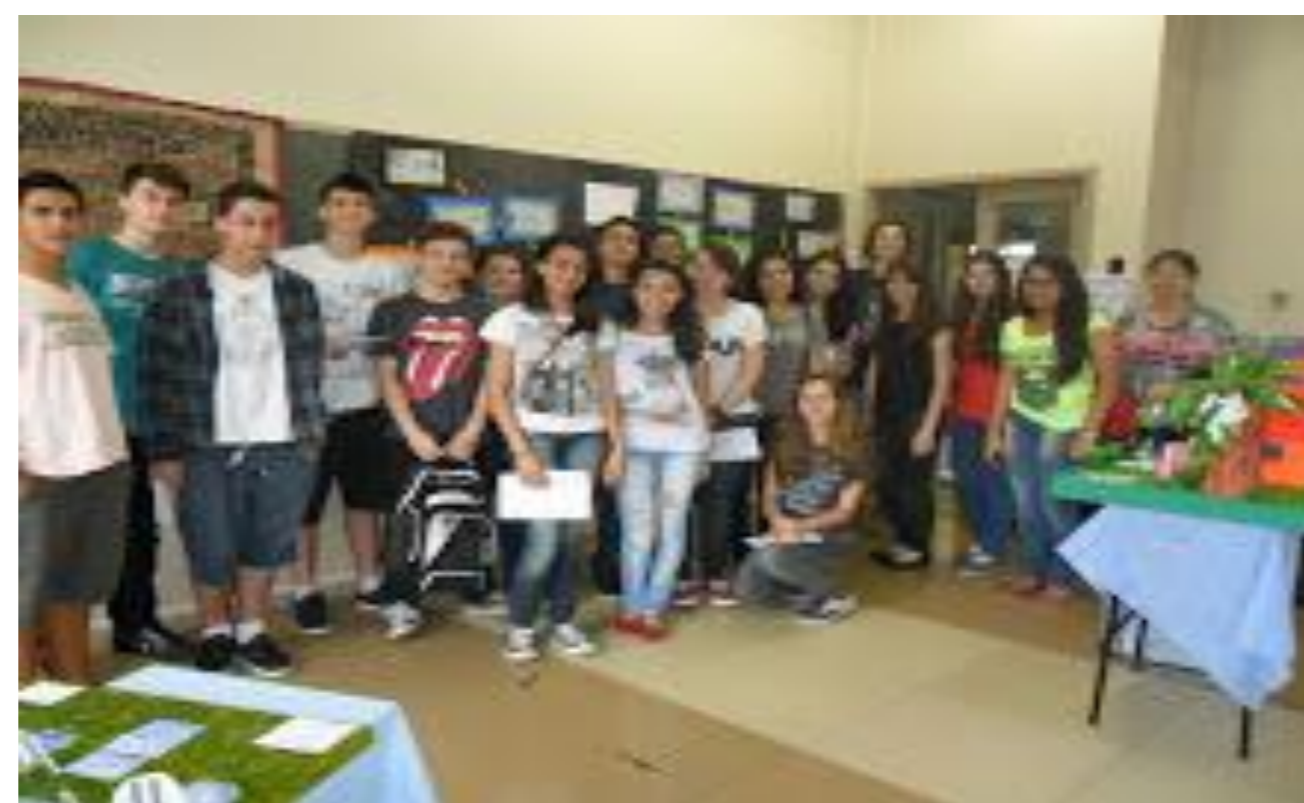
Visita de escola/empresa