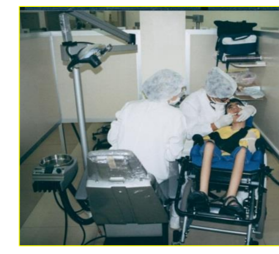
ATENDIMENTO NA UNIVERSIDADE