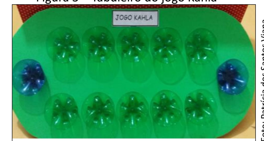
Figura 3 – Tabuleiro do jogo Kahla