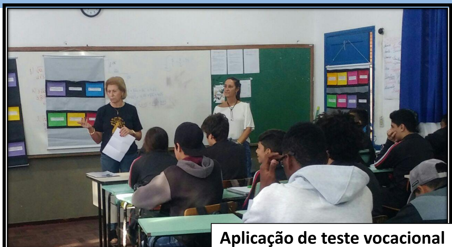
Aplicação de teste vocacional

Os serviços oferecidos por este projeto, sob a responsabilidade dos cursos de Educação nas Organizações e Pedagogia, totalizaram até a presente data (06.07.18) 1.502 pessoas atendidas. Também ocorreu divulgação destes serviços em escolas e curso preparatório ao ENEM e na rede de internet com o blog: lopulbra.blogspot.com.br , atingindo mais de 700 pessoas. Salienta-se que há um número bem significativo agendado para o segundo semestre, tendo em vista a finalização do Ensino Médio e a procura por um curso no Ensino Superior. É gratificante o retorno dos alunos que fazem recepção de curso e retornam a Universidade depois de uma orientação profissional.