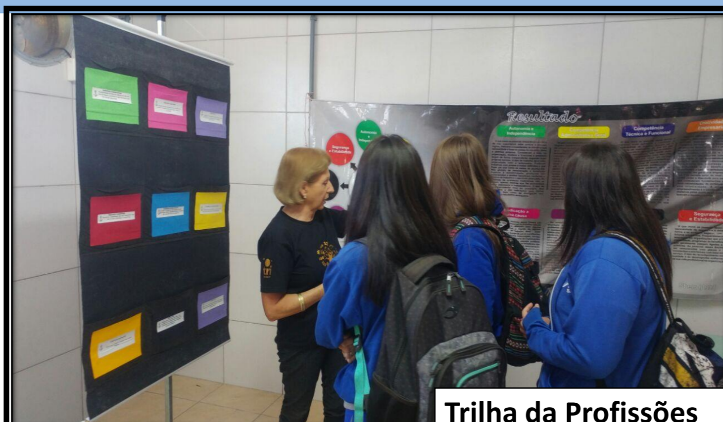
Trilha da Profissões