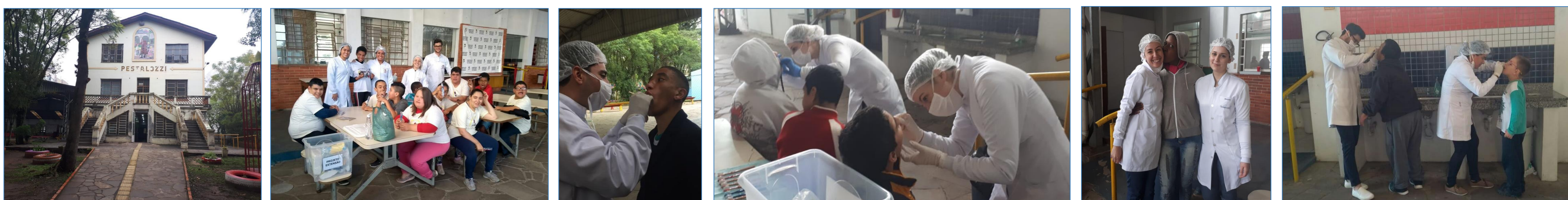
Figs 1 – 6 ACADÊMICOS NO INSTITUTO PESTALOZZI

O projeto trabalha com entidades parceiras que oferecem aos alunos a oportunidade de conhecer realidades diferentes daquela encontrada dentro do curso de graduação. Os alunos desenvolvem atividades de orientação de escovação e aplicações tópicas de flúor, além do contato com os indivíduos com deficiência. Neste ano a entidade parceira é o Instituto Pestalozzi.