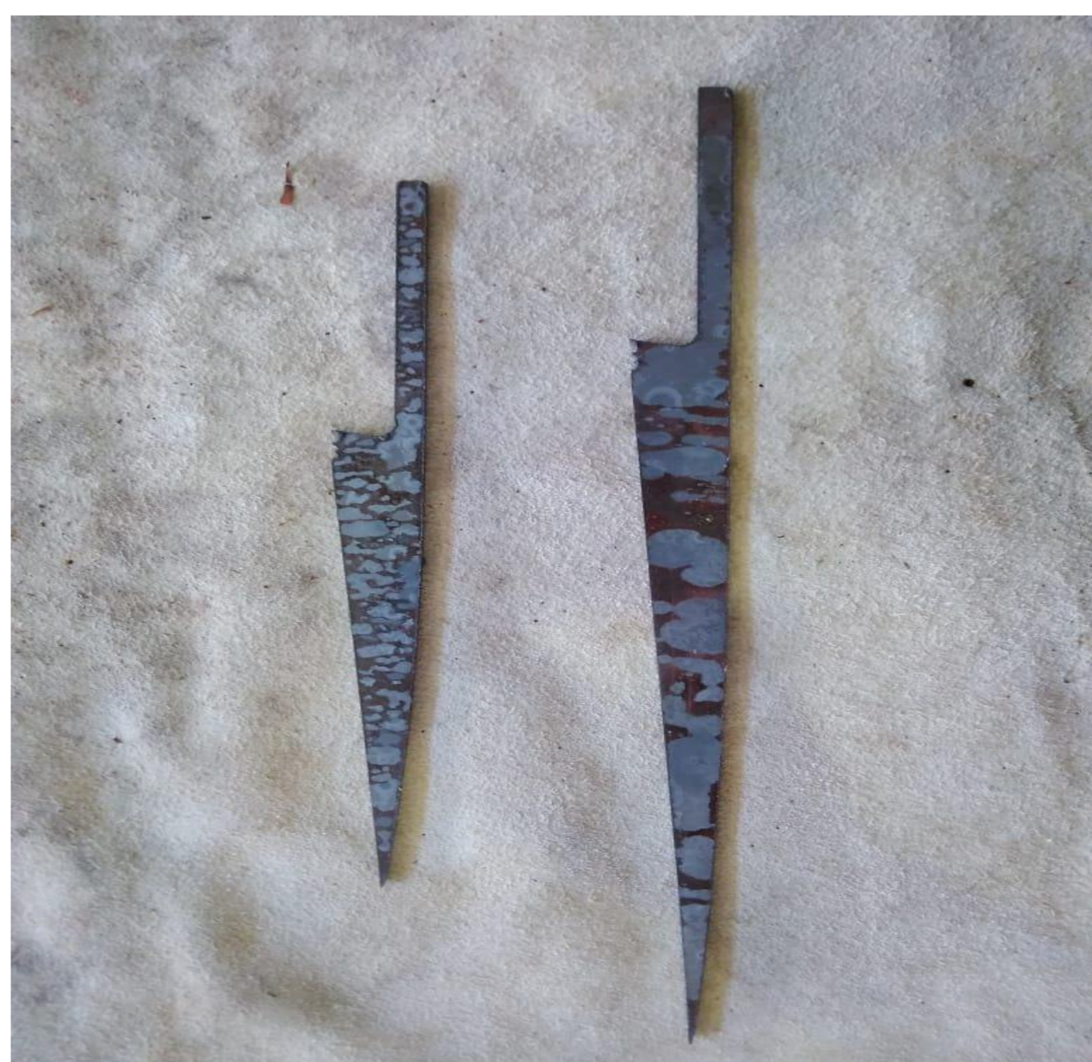
Figura 2 - normalizadas