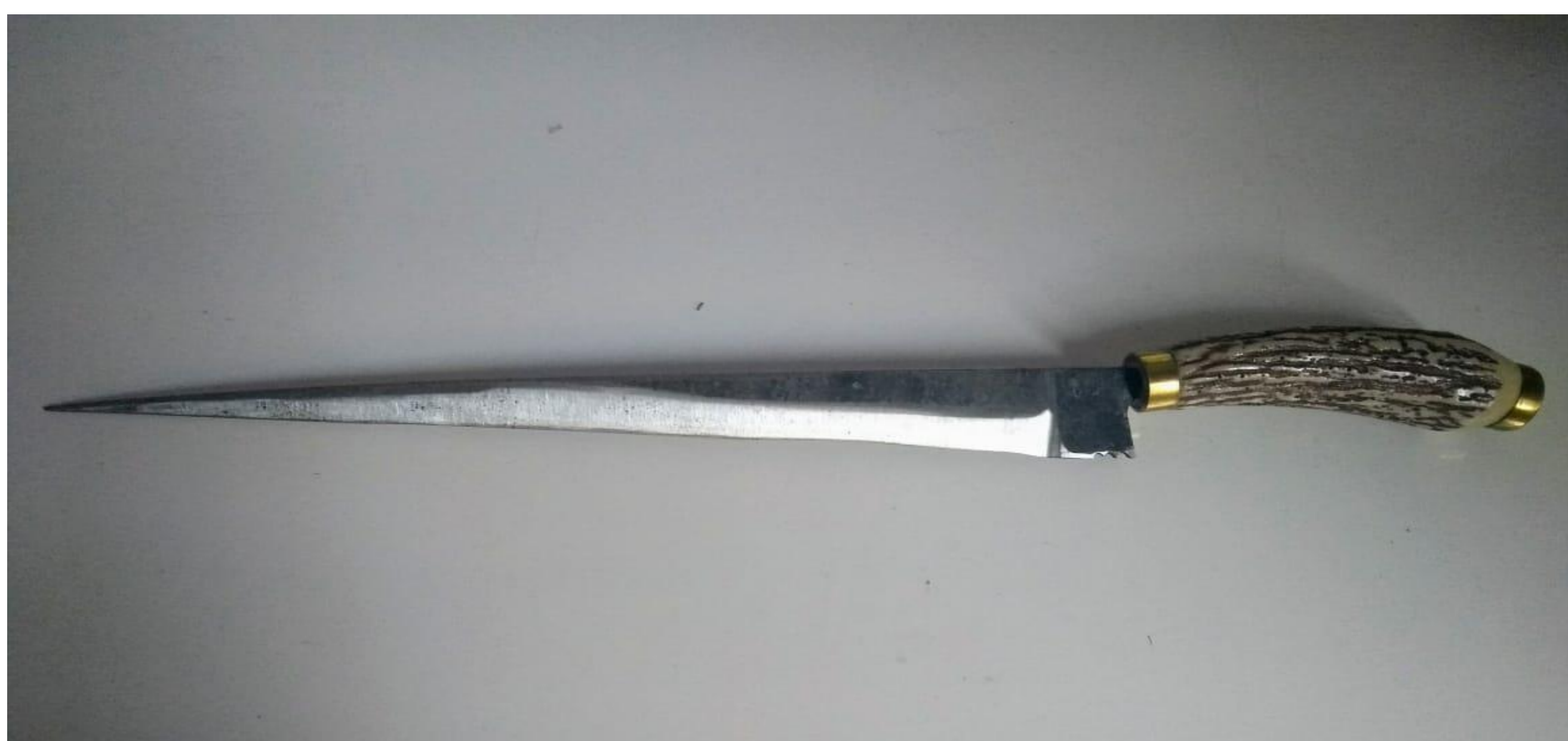
Figura 4 - minha faca finalizada