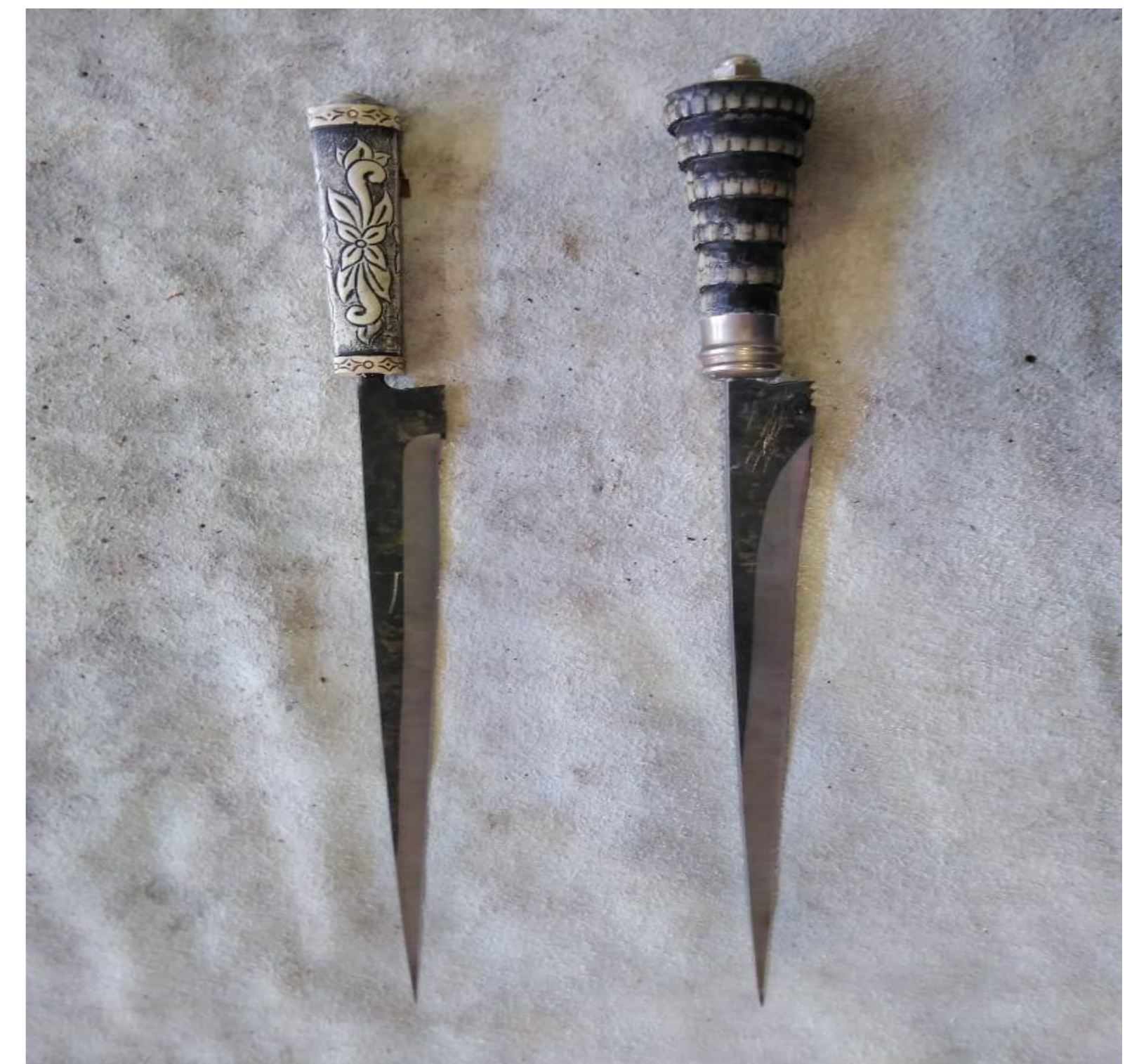
Figura 3 - temperadas, revenidas, afiadas e com cabo