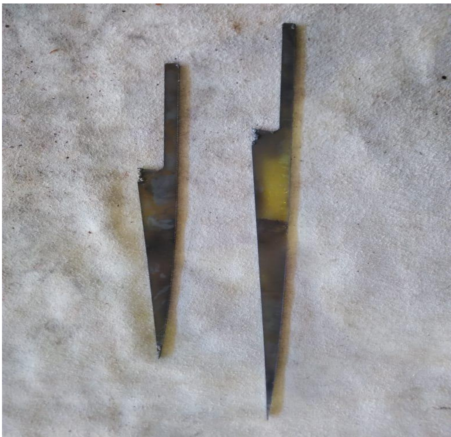
Figura 1 - cortadas a plasma

Da figura 1 a 3 é o processo de fabricação da faca. Na figura 4 é minha faca finalizada.