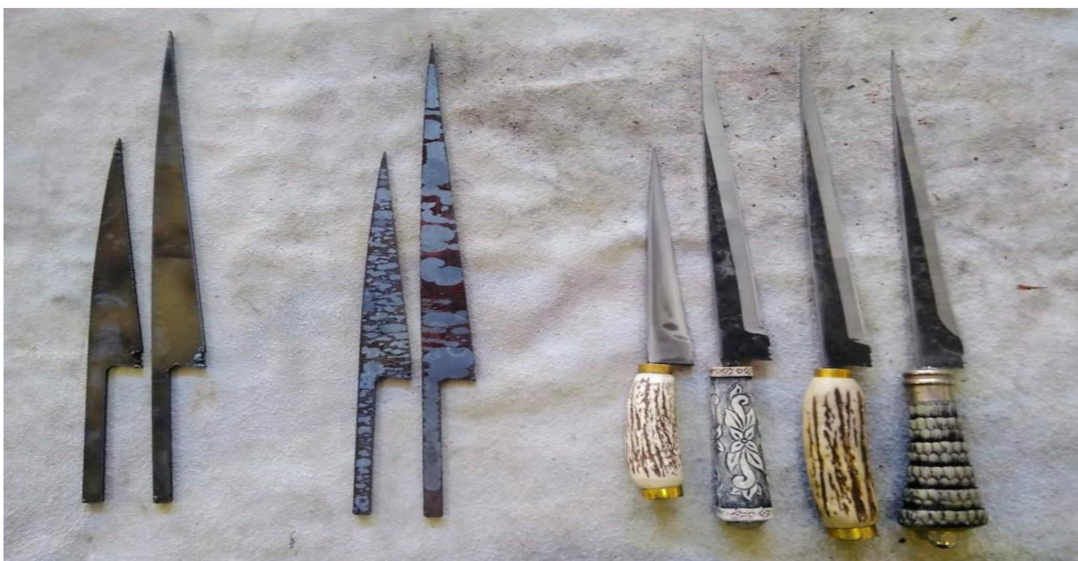
Figura 1 – Da esquerda para direita as duas primeiras facas são cortadas a plasma. As duas do meio estão normalizadas. As últimas são prontas.