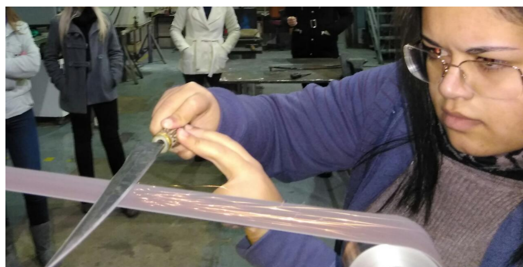
Figura 5 – Fazendo a afiação