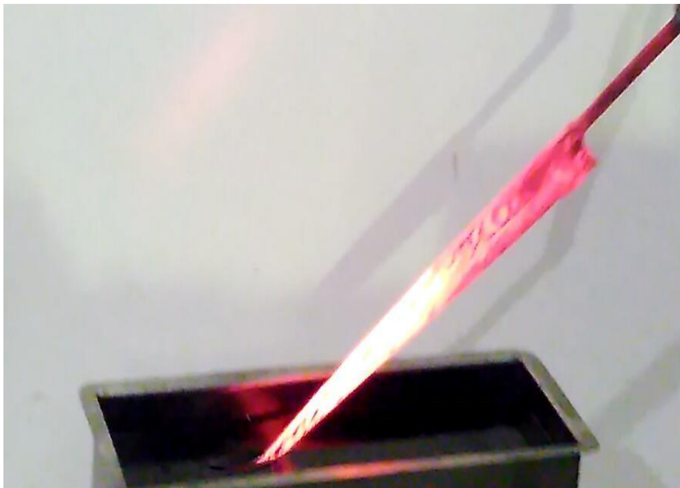
Figura 2 – Têmpera da faca