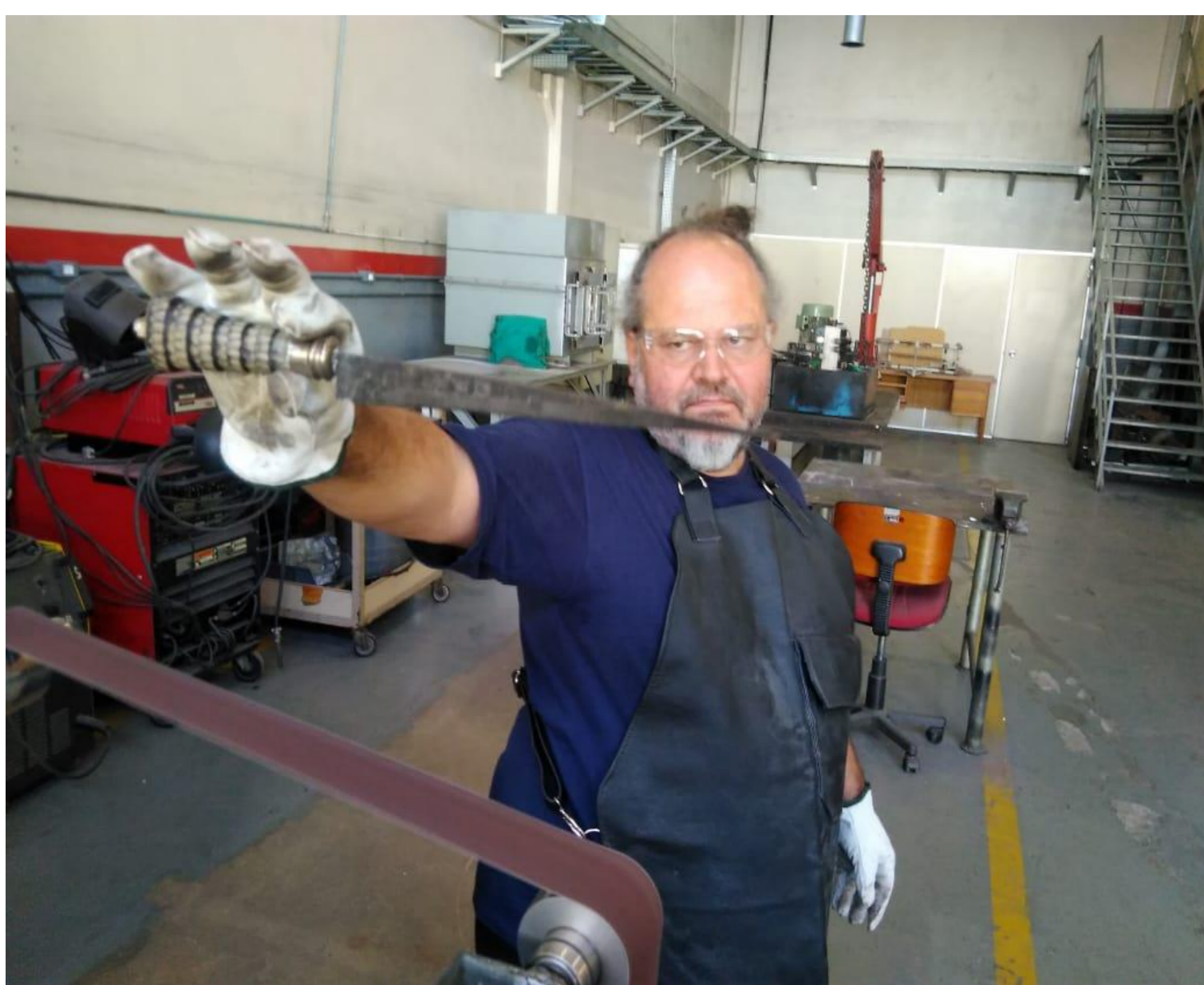
Figura 4 – Observando alinhamento