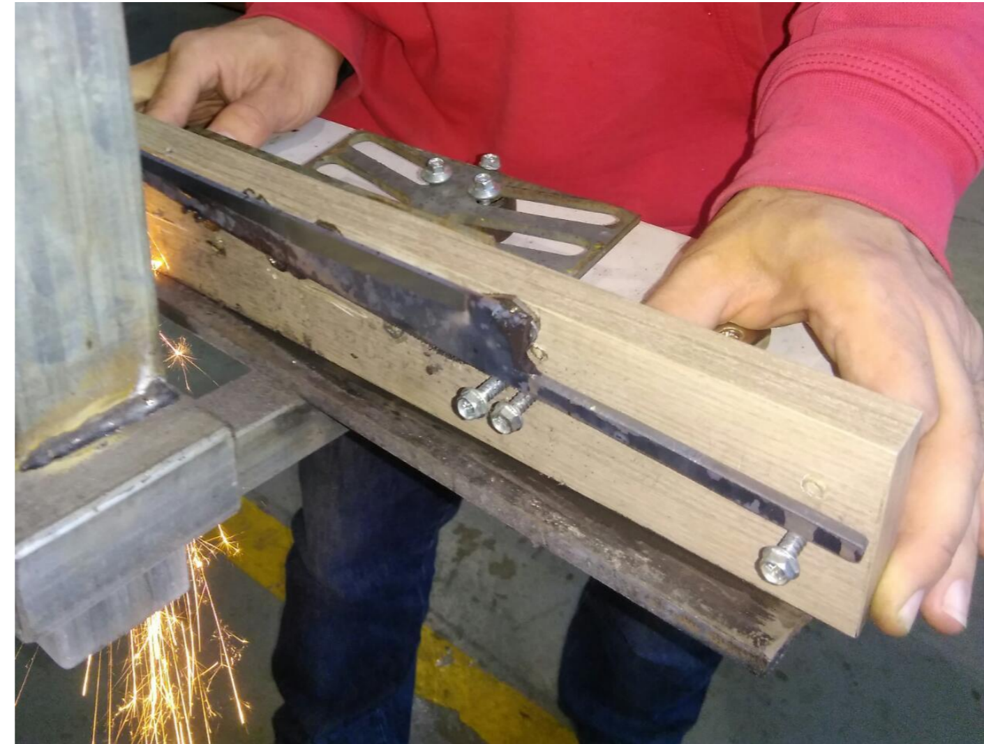
Figura 3 – Confeção do gume