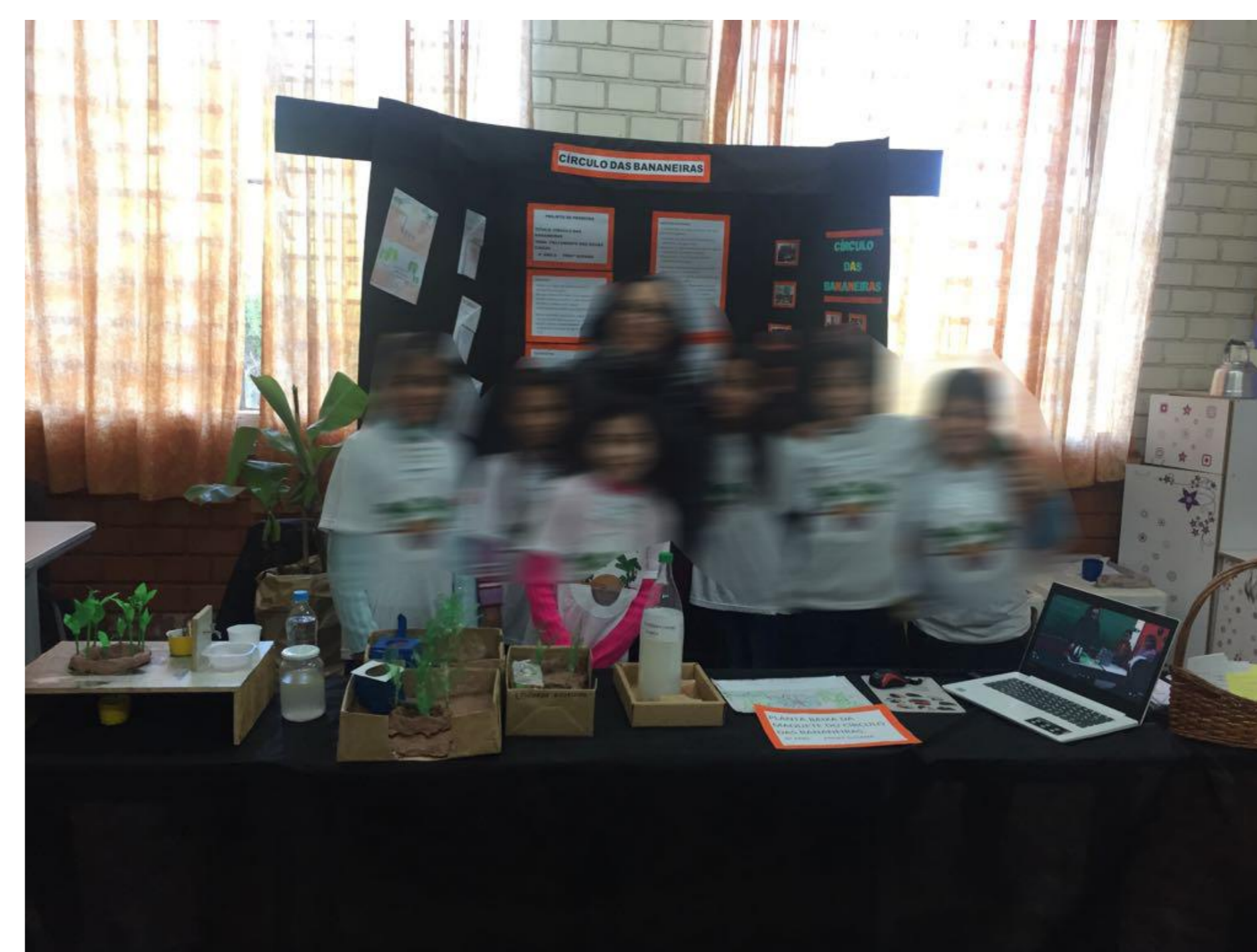
FIGURA 03 – III Feira de Iniciação Científica da escola .

francielecarineschneider@gmail.com francieli_1702@hotmail.com