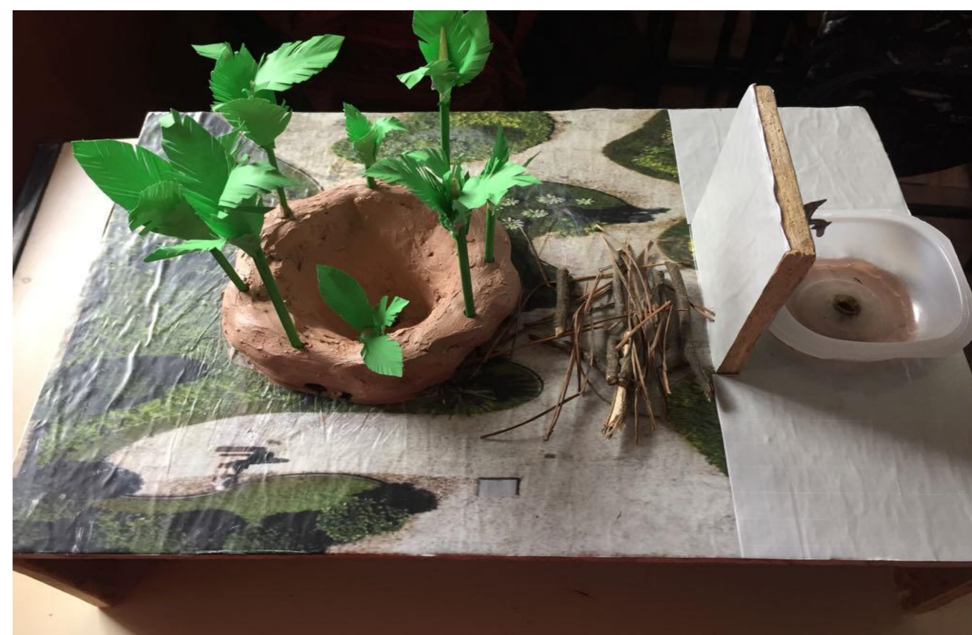
FIGURA 02 – Maquete representando o sistema funcional da técnica.