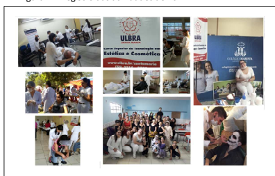
Figura 1 - Registro das atividades de 2017.

Entre 2017 e 2018, foram executadas no projeto Estética em Prática Aliada à Qualidade de Vida na Comunidade, foram realizadas 50 atividades eventuais de extensão, e 80 alunos do curso participaram. Os locais de realização foram escolas, postos de saúde, pastorais, casas de longa permanência, e empresas locais. Algumas atividades estão ilustradas nas figuras 1 e 2, abaixo.