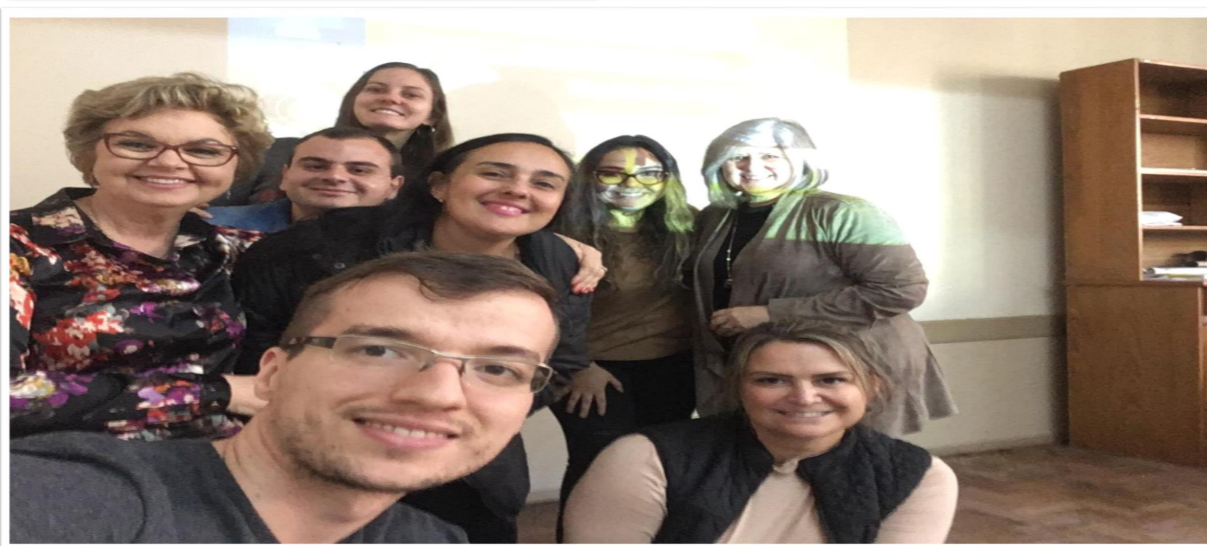
Imagens autorizadas pelos autores: Grupo de Vacinas Pet- Saúde reunido nas instalações da ULBRA e Secretária de Saúde.

CONSIDERAÇÕES FINAIS: Portanto, pode-se ressaltar que o pré e pós teste realizado, proporcionou ao grupo perceber que a interação entre as diferentes áreas da saúde contribui de maneira fundamental para o aprendizado do futuro profissional, ou seja, foi possível vivenciar a interprofissionalidade.